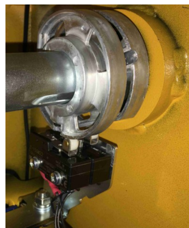
Ansicht Endschalter mit Schaltnocken auf Welle montiert